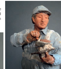
Das raue Material der Figuren zeigt schwere Arbeit und die starken Persönlichkeiten.

Den Skulpturen und Bildern Cecilia Herrero-Laffins sieht man die Entschlossenheit der Frauen an. In ihrer schweren Arbeitskleidung schufteten die Arbeiterinnen mit Ziegeln, Mörtel