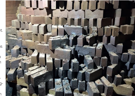
Beim diesjährigen Brand sind aufgrund sehr hoher Temperaturen viele Steine ineinander verschmolzen.

Seit Oktober holt das Museumsteam die gebrannten Ziegelsteine aus dem Ofen und sortiert sie nach verschiedenen Brandqualitäten. Gebrannt wurden Ziegel im Reichsformat mit einer Länge von 25 cm, einer Breite von 12 cm und einer Höhe von 6,5 cm. Die Qualität der Steine ist in diesem Jahr sehr unterschiedlich. Sie wurden zum größten Teil sehr hart gebrannt und erreichten sicher eine Temperatur von über 1100 Grad. Besonders im ersten Drittel des Ofens wurden allerdings auch noch höhere Temperaturen erzielt. Hier sind die Steine teilweise verbacken. D. h., die Oberfläche der Steine hat sich verflüssigt, sodass die Steine miteinander verbunden sind. Die Aufgabe des Teams ist jetzt, die Steine auseinander-