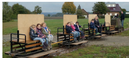
Selbst die beliebte Feldbahn auf dem Ziegeleigelände wurde corona-konform umgebaut.

An dem Zug auf dem Foto erkennt man schnell, dass die Corona-Pandemie an den Feldbahnen im Ziegeleimuseum und dem rollenden Material nicht spurlos vorbeigezogen ist.