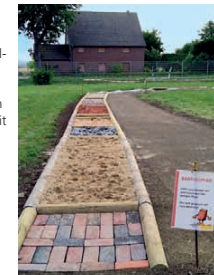
Der Barfußpfad ist ein neues Highlight auf dem Gelände des Museums und freut sich auch im nächsten Jahr auf viele Füße.

Die zehn Museumspädagoginnen und Museumspädagogen entwickelten aber auch noch das Konzept eines Familiensommers. Zehn wechselnde Stationen auf dem gesamten Museumsgelände luden Familien mit Kindern ein, gemeinsam zu spielen, zu basteln und zu bauen. Das Konzept war so erfolgreich, dass das Museum in den Herbstferien eine Fortsetzung startete. Über 2000 Kinder besuchten das Museum in den Ferienmonaten. Ein Konzept, das sicherlich in den kommenden Jahren wiederholt wird.