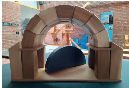
Ein romanischer Bogen kann von Kindern in der Experimentierebene selbst erbaut werden.

Im Rahmen der neuen Dauerausstellung, die voraussichtlich 2024 eröffnet wird, plant das Museum den Umzug dieser Experimentierebene für Kinder in die große Trockenhorde der Ziegelei Beermann. Dort soll dann mit einem neuen Museumspädagogikraum einer große Experimentierfläche und den angrenzenden Mu-