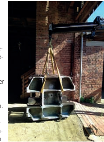
Die Anlieferung des tonnenschweren Feinwalzwerks war ebenso ein Drahtseilakt wie sein Einbau in den Mechanismus aus vielen weiteren Maschinen.

tete sich die Suche nach einem Unternehmen, das diese Sonderanfertigung vornehmen konnte. Der Körper der zweiten Walze wurde geschliffen und gehärtet. Nach Anlieferung der Maschine in Lage begann der komplizierte Einbau: Das zwei Tonnen schwere Werk musste wieder an seinen Platz gehoben und in den aus mehreren Maschinen bestehenden Mechanismus integriert werden. Über vier Wochen benötigten die Metallrestauratoren aus den zentralen Dortmunder Werkstätten zusammen mit den Lagenser Kollegen, um die Arbeiten erfolgreich zu beenden. Besonders stolz ist das Museum darauf, dass trotz der gravierenden Beschädigungen große Teile der Originalsubstanz erhalten geblieben sind.