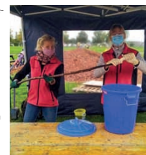
Traditionelles Stockbrot gab es beim Kartoffelfest mit allen Hygienevorschriften – und einem Lächeln hinter den Masken.