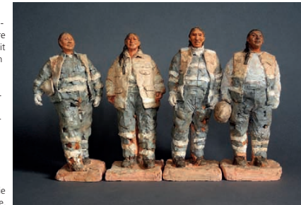
Die Authentizität von Herreros Skulpturen vermittelt einen Eindruck vom harten Arbeitstag der Frauen.

Den Skulpturen und Bildern Cecilia Herrero-Laffins sieht man die Entschlossenheit der Frauen an. In ihrer schweren Arbeitskleidung schufteten die Arbeiterinnen mit Ziegeln, Mörtel